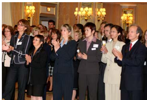
Plus de 200 personnes, représentant les entreprises, les médias et le gouvernement, ont participé aux célébrations honorant les femmes dont les profils ont été inclus dans le répertoire.

directrice de projets de la FWA Québec, ces contributions ont été soulignées à Montréal, à l'automne, à l'occasion du lancement du livre auquel ont assisté plus de 200 femmes et hommes. Monique Jérôme-Forget , présidente du Conseil du Trésor, ministre responsable de l'Administration gouvernementale, et ministre responsable de la région de Montréal, a agi comme présidente honoraire du lancement. L'événement a attiré beaucoup d'attention de la part des médias.