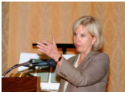
Monique Jérôme-Forget , présidente du Conseil du Trésor, ministre responsable de l'Administration gouvernementale, et ministre responsable de la région de Montréal, assurait la présidence d'honneur du lancement du livre Femmes de Tête/Women in the Lead. Dans son discours, elle a souligné l'importance de nommer davantage de femmes aux conseils d'administration des entreprises.